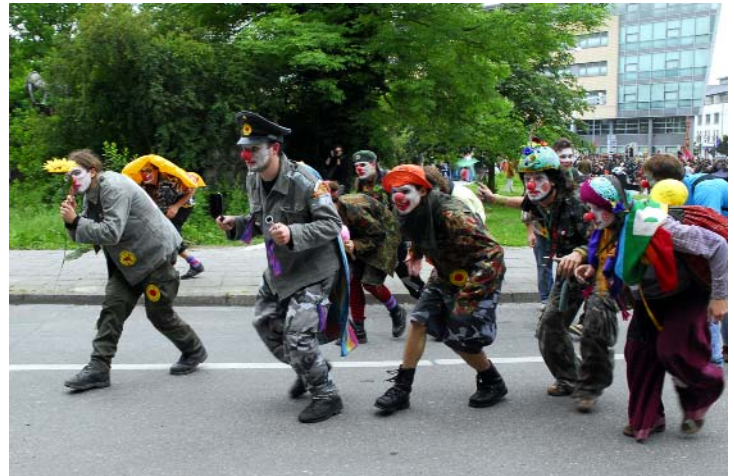
Protest beim G8-Gipfel in Heiligendamm