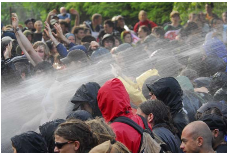
Wasserwerfer gegen den Protest beim G8-Gipfel in Heiligendamm