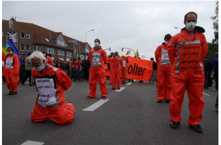
Protest beim G8-Gipfel in Heiligendamm

Die selbstgefällige Täuschung Europas lautet: Armut sei nun mal nicht politisch. Sie sei marktgott- oder naturgegeben. Dass die europäisch genährten Regimes, die