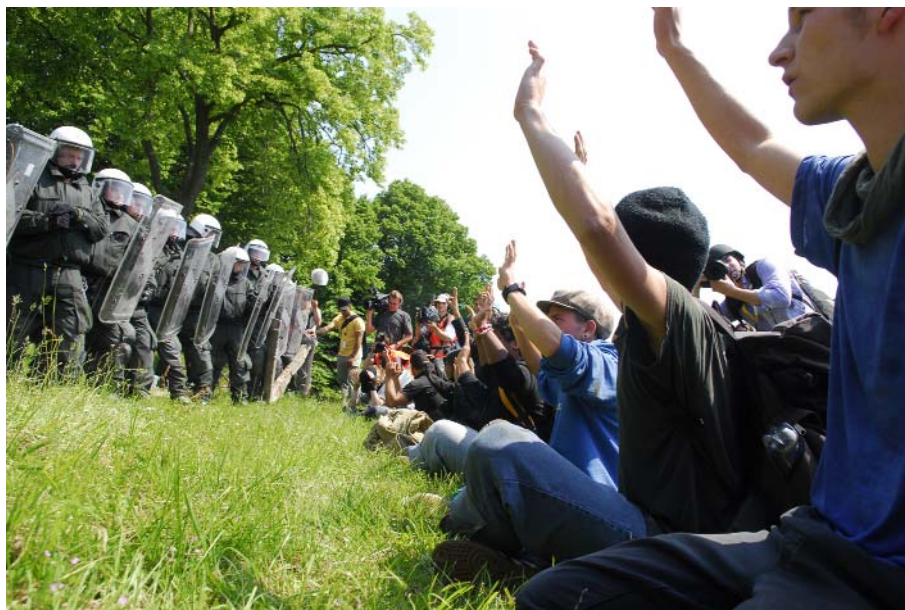
Protest beim G8-Gipfel in Heiligendamm

Aktuell entstehen neue ungeklärte Fragen bei Sitzblockaden gegen nationalistische, antisemitische, rassistische Versammlungen durch die